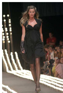
Frau im Kleid

Männer tragen dagegen eher Hosen und Anzüge. Auch auf Grund der körperlichen Unterschiede, tragen Frauen und Männer häufig unterschiedliche Kleidung. Der Büstenhalter beispielsweise stützt die weiblichen Brust.