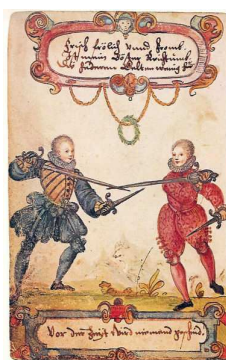
Adelige Studenten im Mittelalter