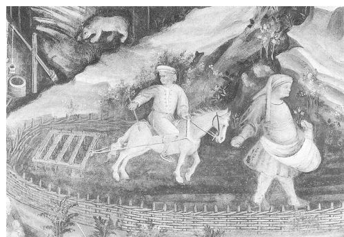
Bauern im Mittelalter

Die Farbe der Kleidung gab oft Auskunft über den gesellschaftlichen Status. Purpurrot, bis heute die teuerste Farbe, durfte beispielsweise zu Zeiten Neros (54 bis 68 nach Christus) nur von römischen Kaisern getragen werden.